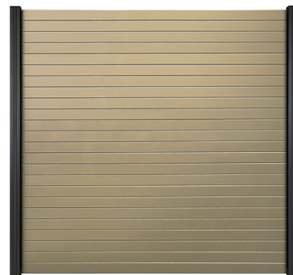
DARK LINE ALUMINIUM RHOMBUS SANDFARBE PULVERBESCHICHTETE ALUMINIUM-RHOMBUS-BOHLEN 180 X 180 CM

Verwenden Sie die separat erhältliche Elephant® LED-Pfosten Beleuchtung und LED-Pfosten Lichtleiste mit Solarstrom (H), um Ihren Zaun stimmungsvoll abzuschließen.