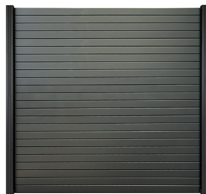
DARK LINE ALUMINIUM RHOMBUS ANTHRAZIT PULVERBESCHICHTETE ALUMINIUM-RHOMBUS-BOHLEN 180 X 180 CM

Verwenden Sie die separat erhältliche Elephant® LED-Pfosten Beleuchtung und LED-Pfosten Lichtleiste mit Solarstrom (H), um Ihren Zaun stimmungsvoll abzuschließen.